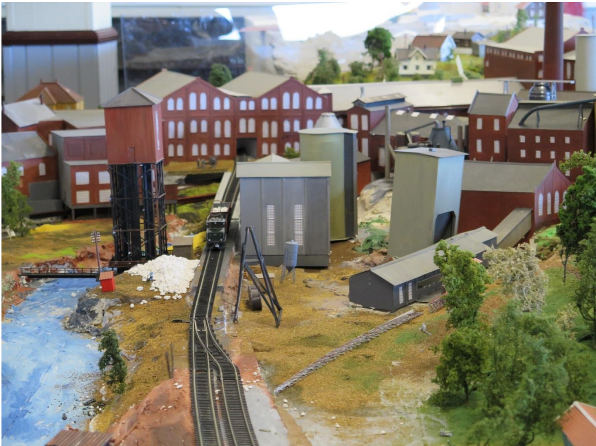
Et lite tettsted har gjenoppstått i skala 1:87. (GWL)

Modellen vises fram i helgene om sommeren. Utstillingen holdes åpen ved dugnadsinnsats av frivillige.