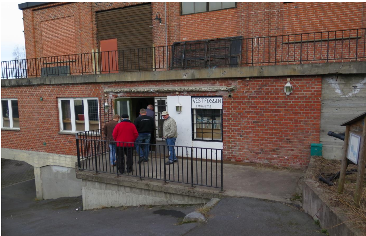
Besøkende på vei inn i det som tidligere var en av Norges viktigste cellulosefabrikker. (GWL)

Det lille skiftelokomotivet som tilhørte Vestfos Cellulosefabrik, kalt "Trikken" eller "Maskin", sto i mange år på Norsk Kjøretøymuseum på Lillehammer. Entusiaster fra Vestfossen dannet imidlertid "Trikkens Venner" og sørget for å få det lille klenodiet, som er et av landets eldste elektriske lokomotiver, tilbake til Vestfossen.