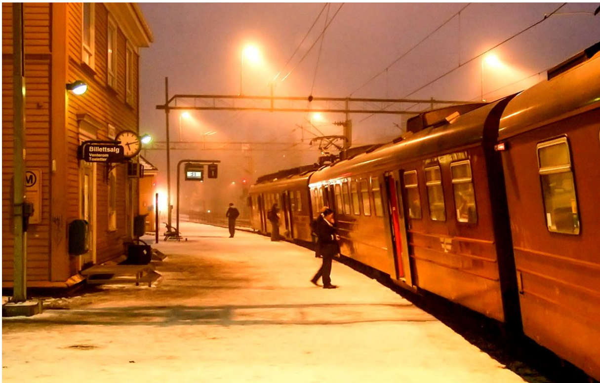
Vinterlig stemning på Kolbotn stasjon 30. januar 2005

Nr. 111 Desember 2015 ISSN: 0805-7753 Organ for Norsk Jernbaneklubb Lokalavdeling Østfoldbanen