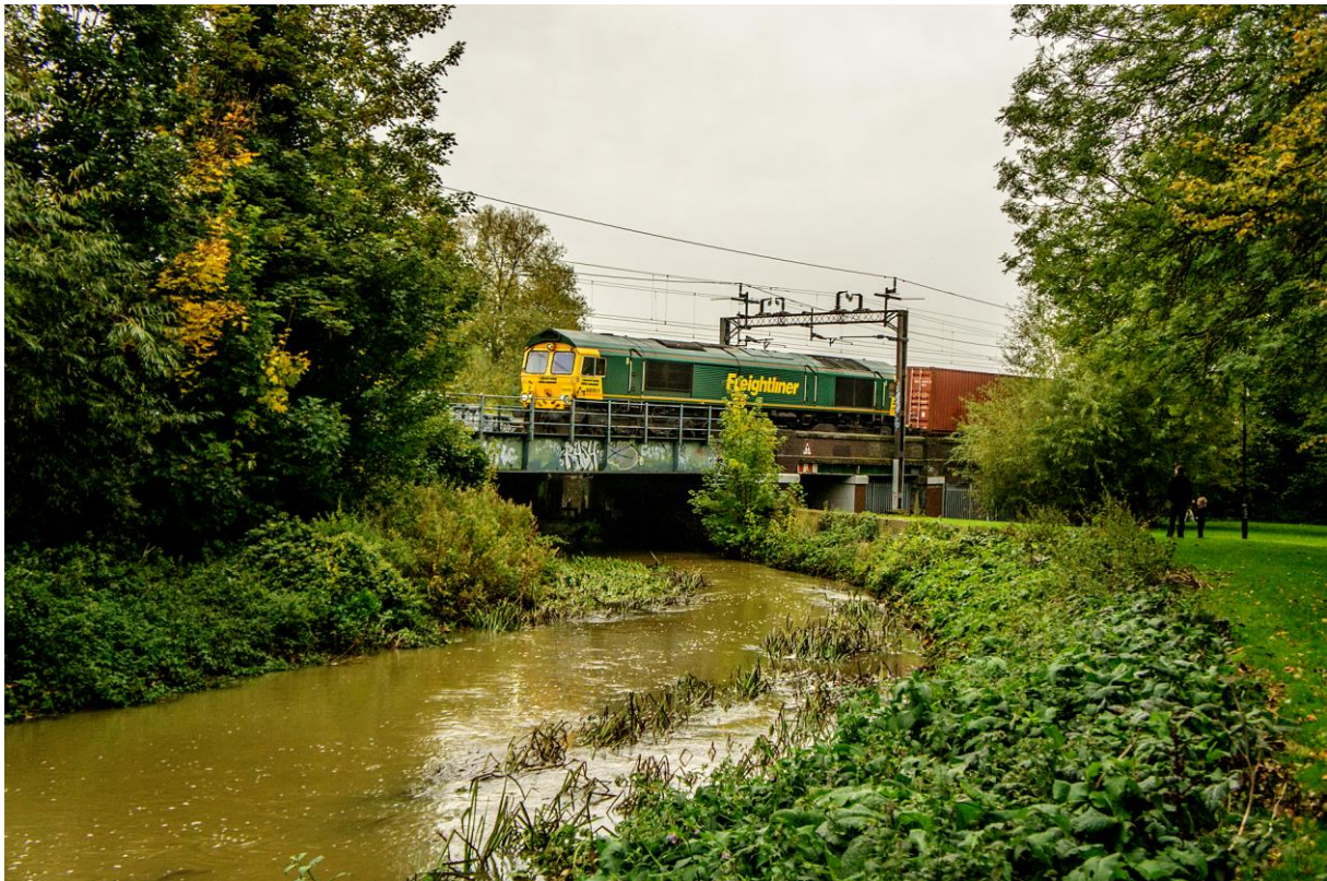
Et godstog trukket av Class 66 ankommer Northampton sørfra. (LHR)

I tillegg er det også et høyst begrenset antall tog mellom London og Crewe som benytter loopen.