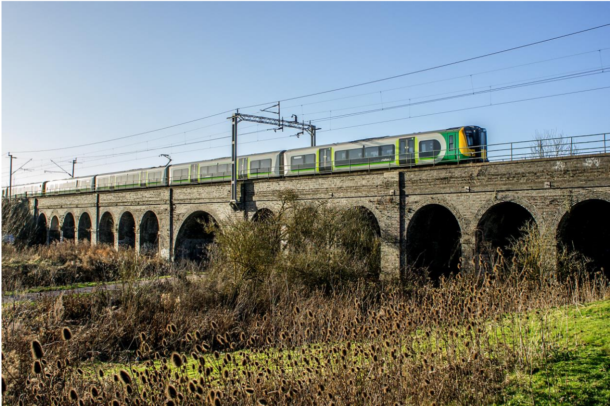
To sett av Class 350 krysser elva Nene på 15 Arch Viaduct (LHR)

Den engelske landsbygda er et overfløydighetshorn av maleriske fotosteder for trainspotters, og omegnen rundt Northampton er ikke noe unntak. Noen få kilometer sørvest for Northampton Station ligger en bru som nok figurerer på utallige jernbanebilder fra denne delen av Midlands, den såkalte «15 Arch Viaduct» som er like gammel som loopen og krysser elva Nene.