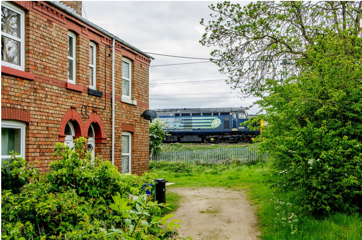
Over: Vårlig idyll i Milton Malsor. Et arbeidstog fra Direct Rail Services, trukket av et lokomotiv av Class 37, passer gjennom landsbyen. (LHR) Under: Grønn vinter ved den berømte golfbanen i Collingtree. (LHR)