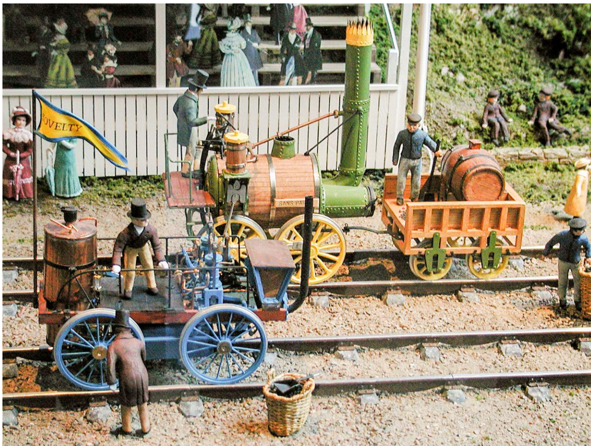
Over: På jernbanemuseet i Ängelholm er det et flott diorama som viser Rainhill i 1829. Under: Et annet detaljrikt diorama hvor det er lagt mer vekt på det maritime.