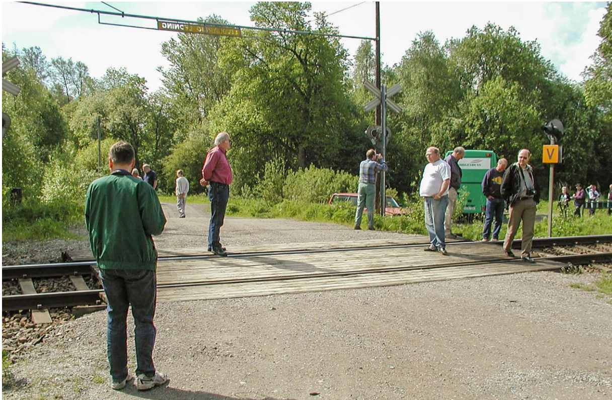
Jernbanearkeologi på Mon mellom Kornsjø og Ed 27. mai 2002. På bildet under er lokalavdelingen på vei mot fjernere mål i mai 2003, nemlig jernbanemuseet i Ångelholm.