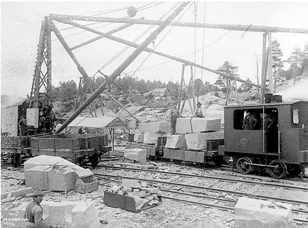
Steinblokker løftes over på vogner for deretter å bli fraktet ned til dampskipsbrygga ved fjorden. (Anders Beer Wilse)

Det var Fredrikstad Stenhuggeri som drev stenbruddene i storhetstiden på Liholt. Liholtbanen ble nedlagt allerede under 1. verdenskrig. Lokomotiv, vognmateriell og skinner ble solgt til skrappris og ga mer i inntekt enn det hadde kostet å anlegge banen.