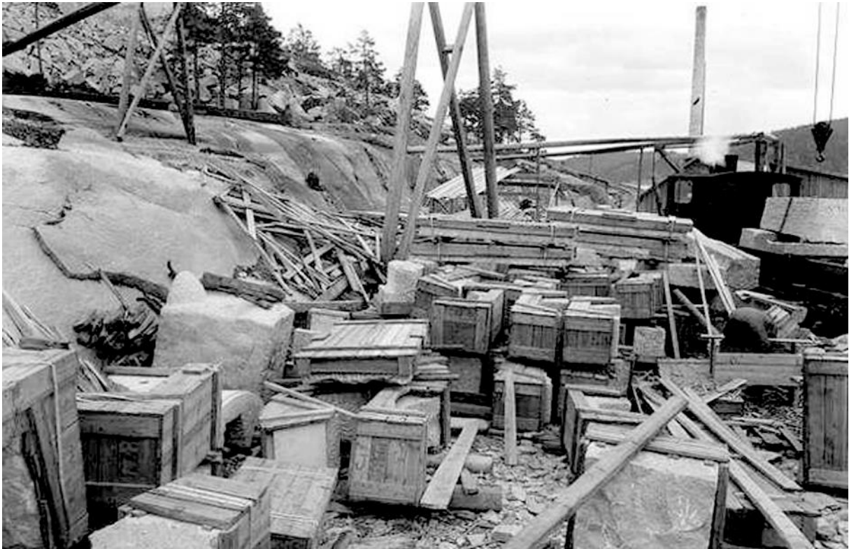
Over: Opplagringsplass ved brygga (Anders Beer Wilse)