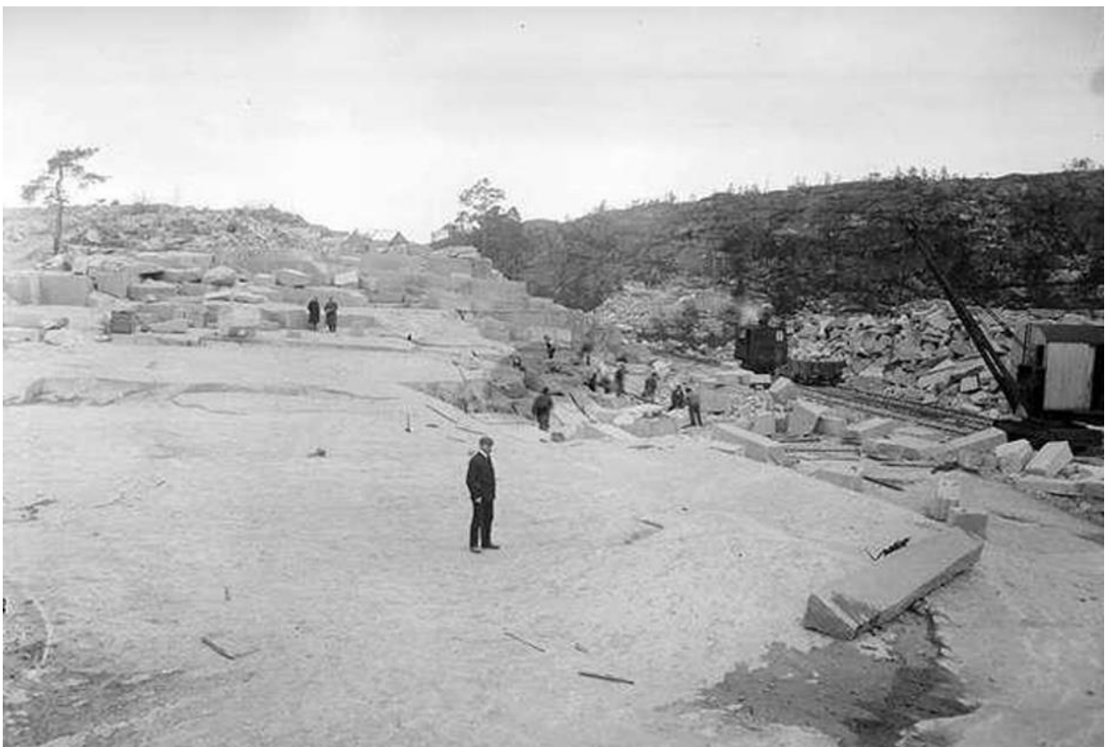
Under: Fra selve bruddet (Anders Beer Wilse)