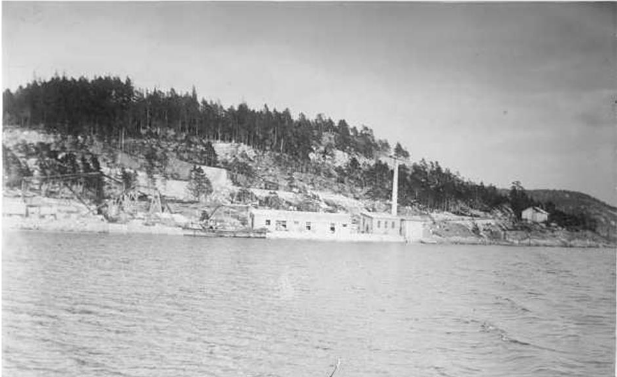
Steinhuggeriets brygge ved Iddefjorden (Anders Beer Wilse)

Lokalavdelingens tur lørdag den 24. mai gikk til Liholt i Idd, rett syd for Halden.