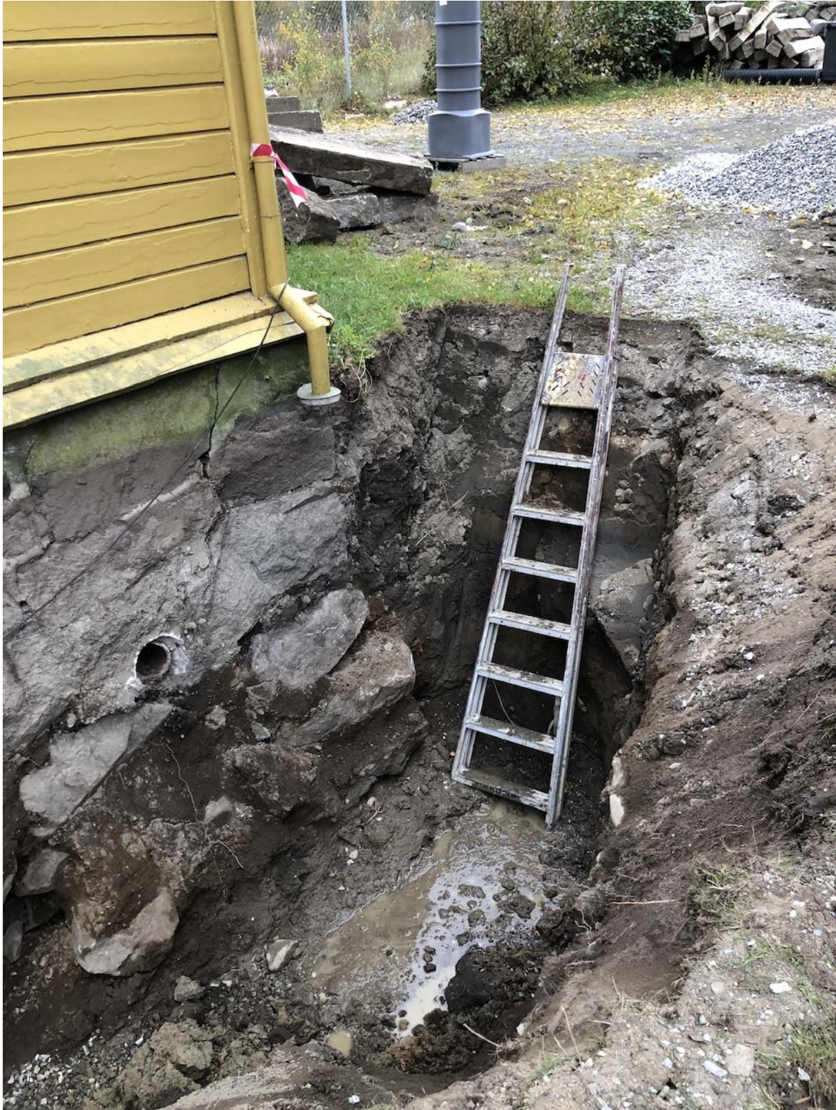
Gravearbeidene på utsiden av kjellerveggen er i gang. (Gylmer Bach)