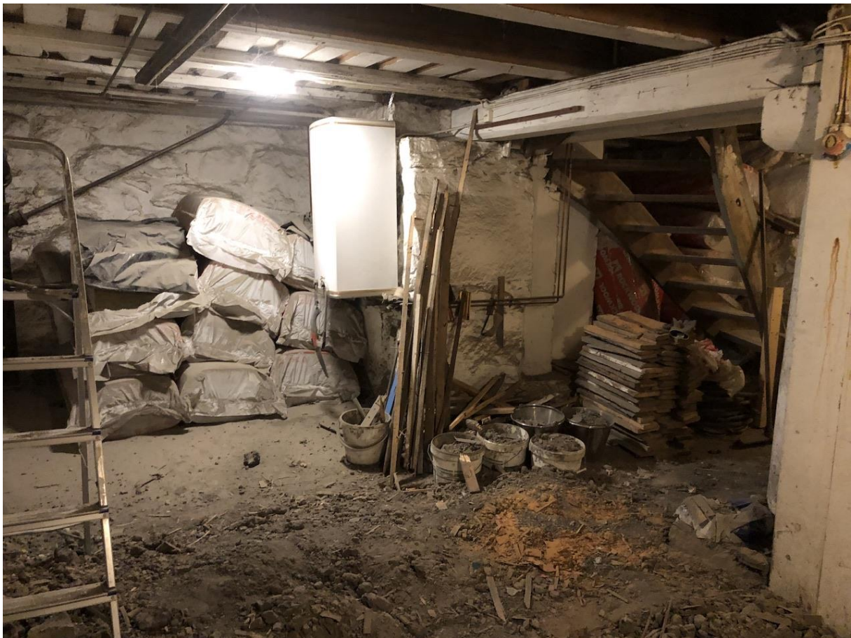
Kjelleren bærer preg av mange år med fuktighet. (Gylmer Bach)

Utendørs og i kjelleren har Bane NOR bistått oss med dreneringsarbeid. Maskinentreprenørfirmaet Solberg har gravd langs baksiden av stasjonsbygningen og lagt ny drenering slik at vi i fremtiden skal unngå å oppleve vann i kjelleren. Dilling stasjon ligger i et område hvor overvann dessverre ikke er uvanlig deler av året, men heldigvis slapp vi heldig unna skadene etter ekstremværet «Hans».