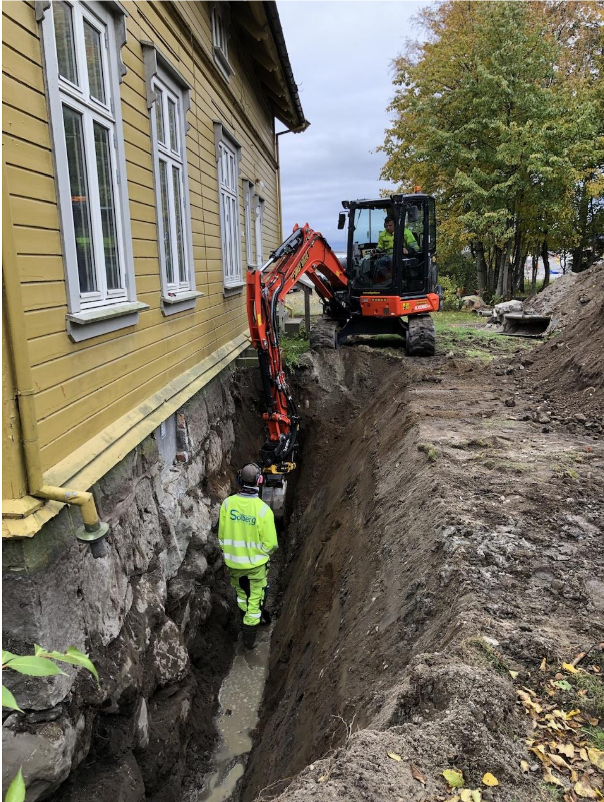
Vi får et visst begrep om dimensjonene på arbeidet. (Gylmer Bach)