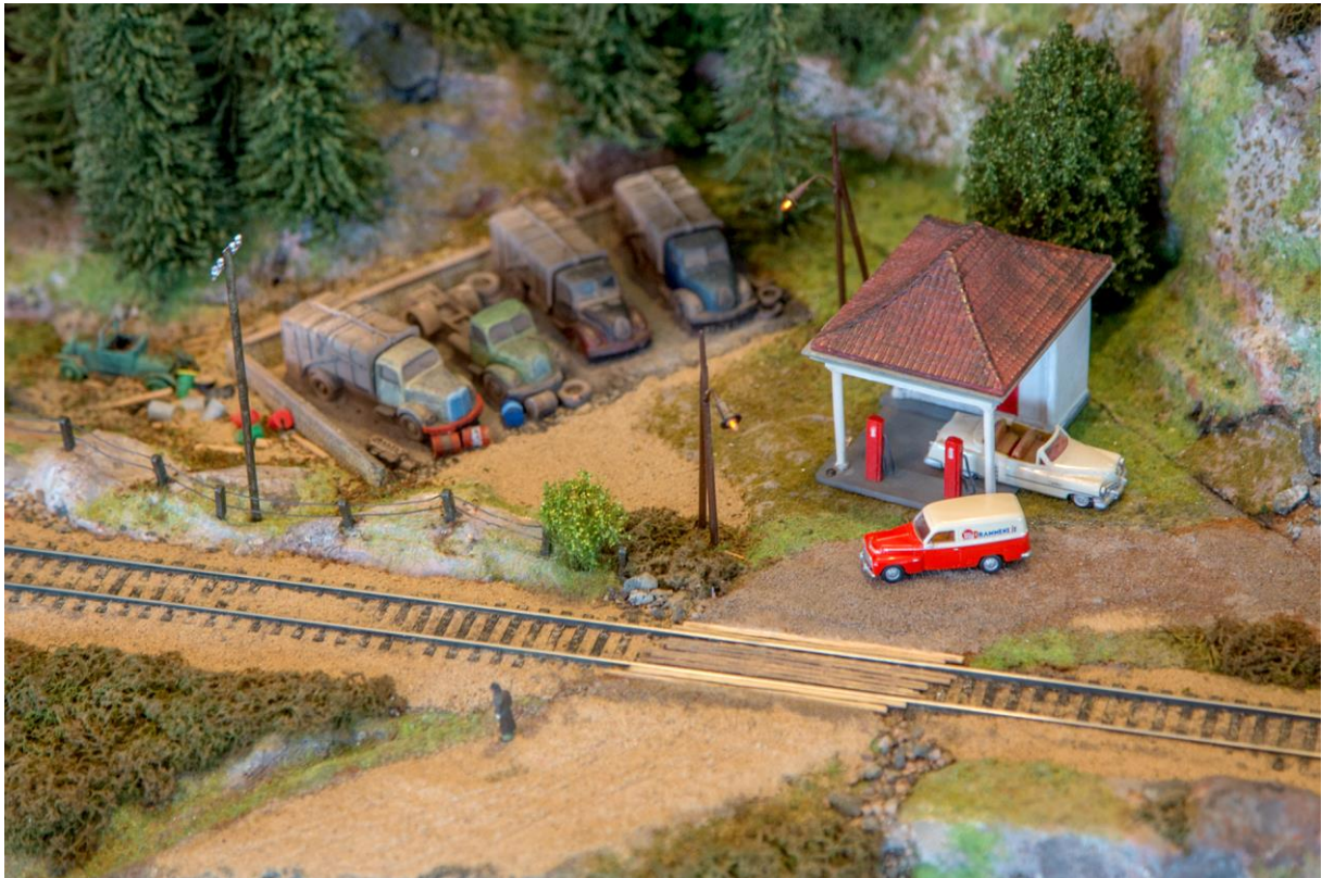
Over: Bensinstasjon med tvilsom beliggenhet. (LHR) Under: Kjell Arne Jacobsen med full kontroll på salget. (LHR)