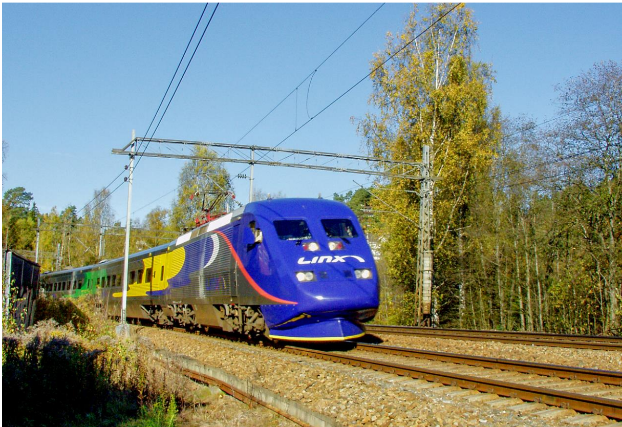
LINX Oslo-Göteborg ved Hauketo 3. oktober 2003 . (LHR)

Nr. 122 september 2017 ISSN: 0805-7753 Organ for Norsk Jernbaneklubb Lokalavdeling Østfoldbanen