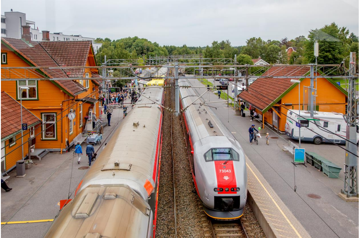
Sommertog og intercitytog side om side. (LHR)

Standen til Bondens Marked kunne varte opp med delikatesser til flere av de forbigående. (LHR)